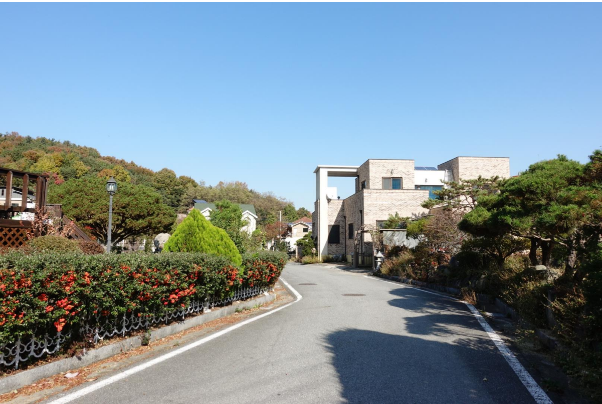
부지 [site] 전면에 열린 조경과 도로 그리고 단독주택의 풍경