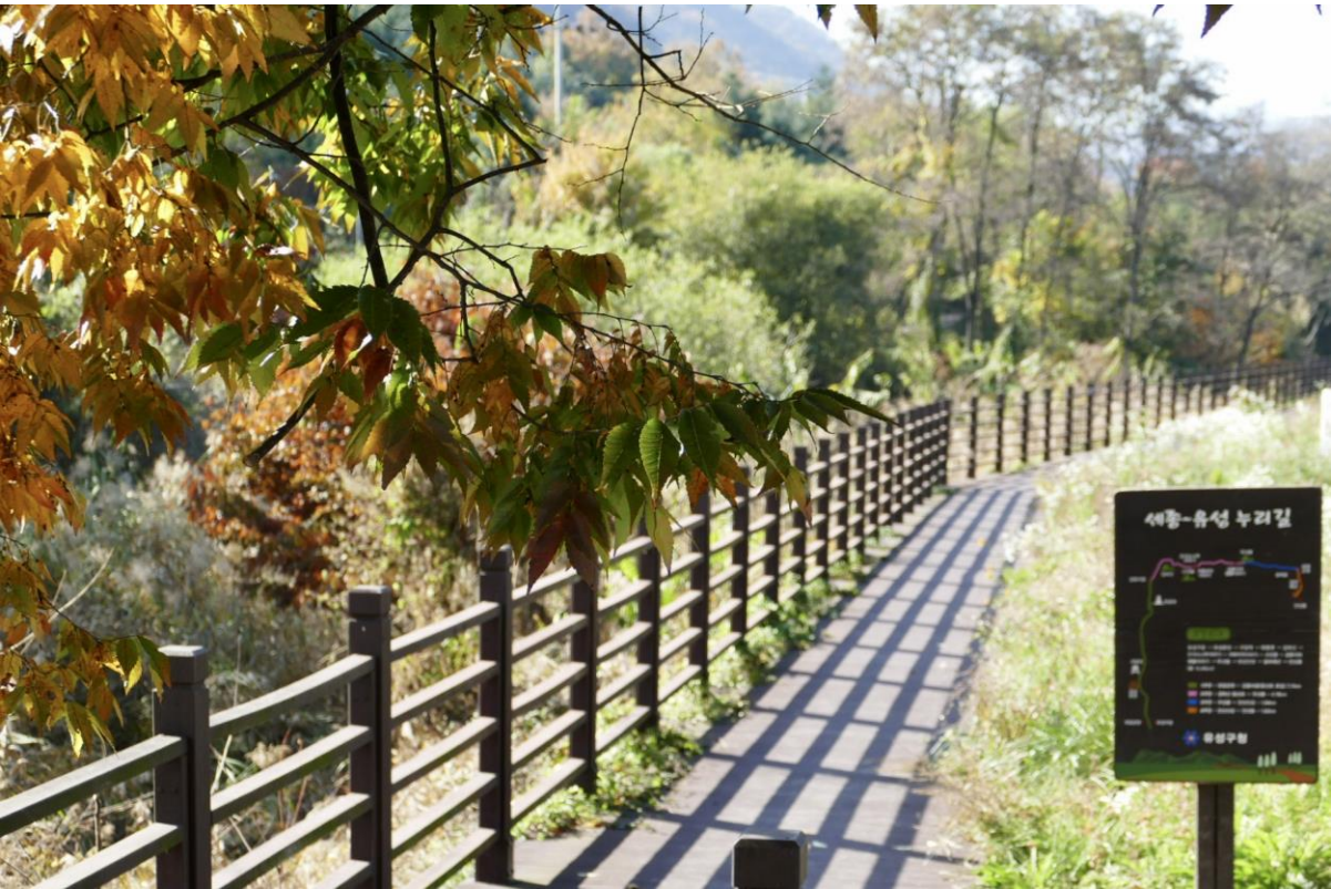
■ 데크길이 설치되어있는 세종-유성 누리길